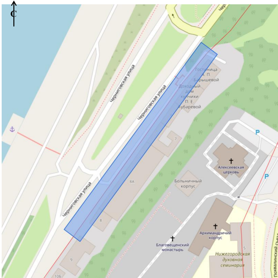
Схема границ подготовки проекта планировки территории (арх. № 128/23)